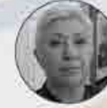
Nesrin Nas ANAP Eski Milletvekili