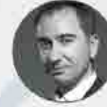
Mustafa Akyol Gazeteci-Yazar