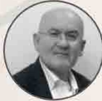
Veli Kondak Sanayi ve Ticaret Bakanlığı